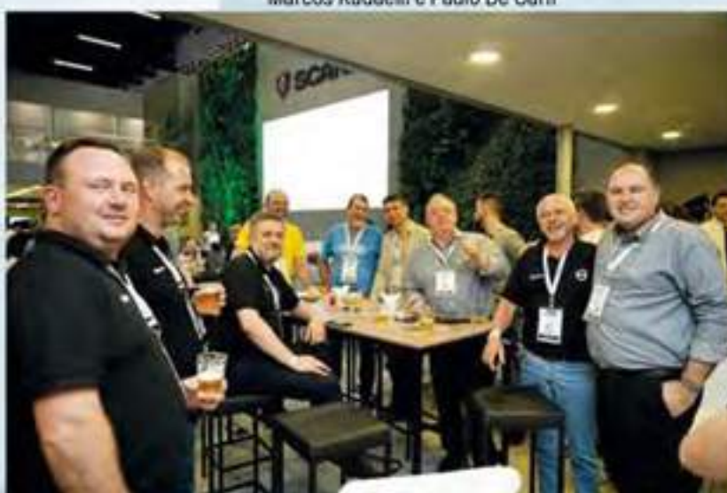
Ambiente descontraído com os clientes da Brasdiesel de Caxias do Sul