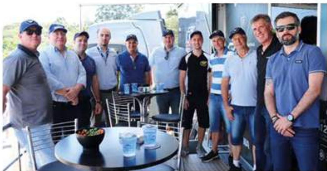
Clientes Brasdiesel Caxias do Sul visitando o stand da Scania.