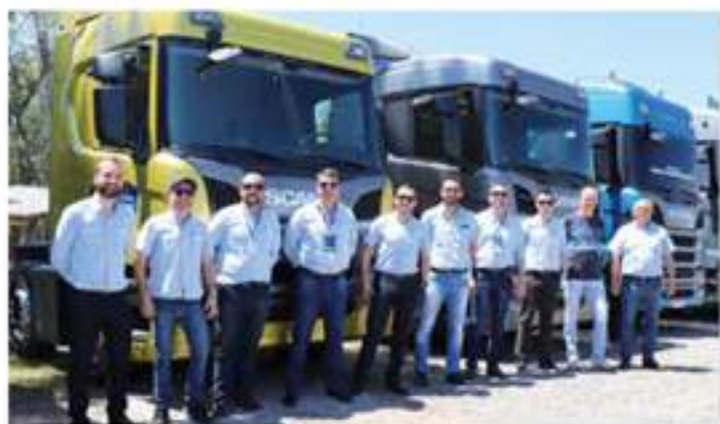
Equipe comercial Brasdiesel Scania.