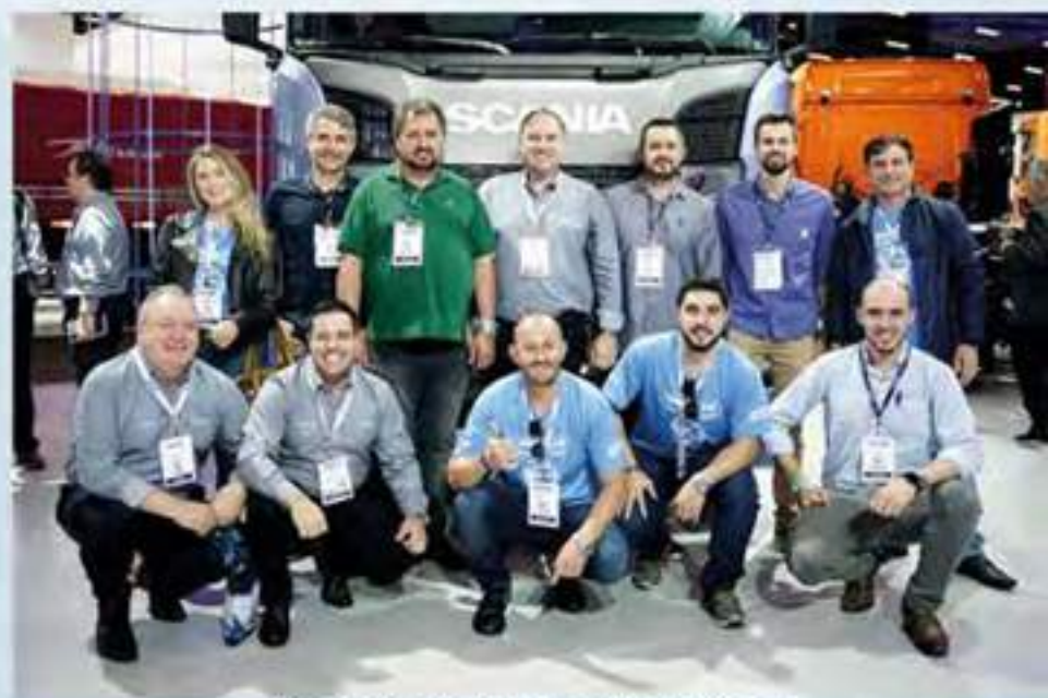
Clientes da Brasdiesel no Stand da Scania

Confira a galeria de imagens dos clientes que estiveram presentes neste grande evento.