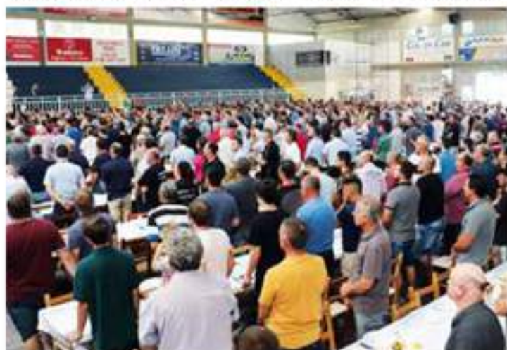
Tradicional almoço Brasdiesel Scania para 2.000 motoristas.