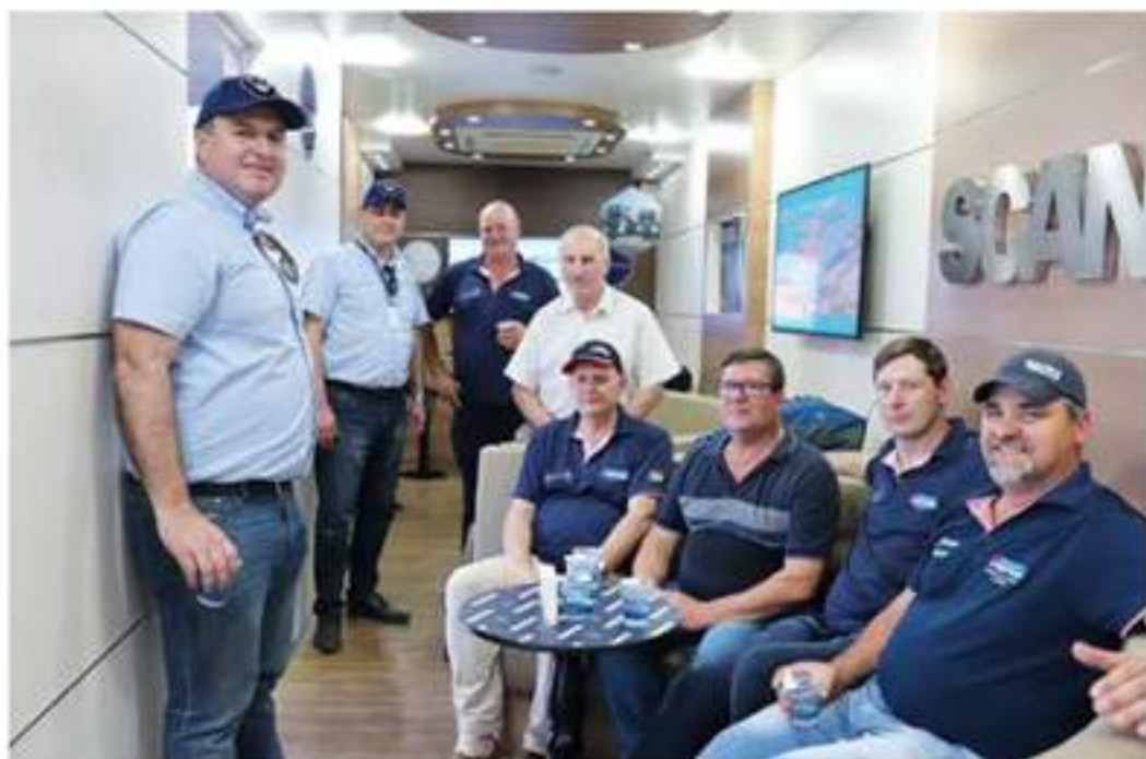
Integrantes da Associação dos Motoristas de Garibaldi junto com a equipe da Brasdiesel.