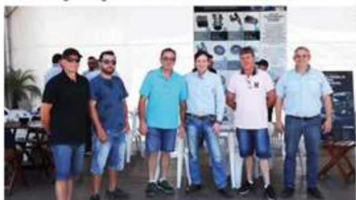
Clientes visitando do Feirão de Peças Scania.