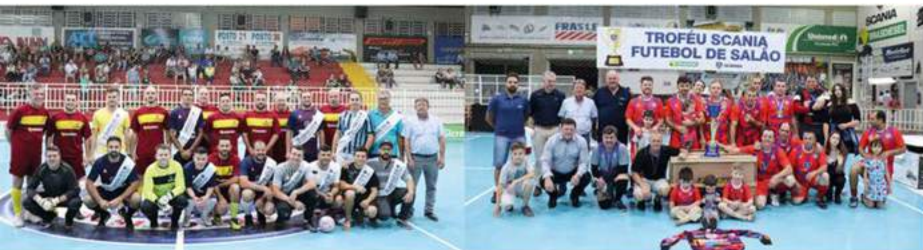
Passagem de faixa do troféu Scania Futebol de salão para os campeões de 2018 - TRANSPORTES SERAFIM