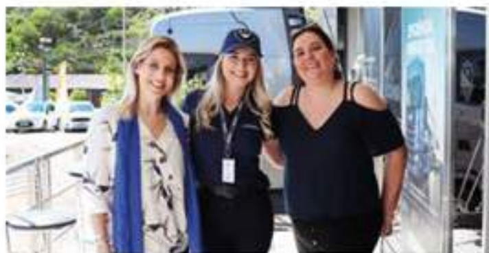
Integrantes do Sindicato das Empresas de Transportes de Carga e Logística no Estado do Rio Grande do Sul.