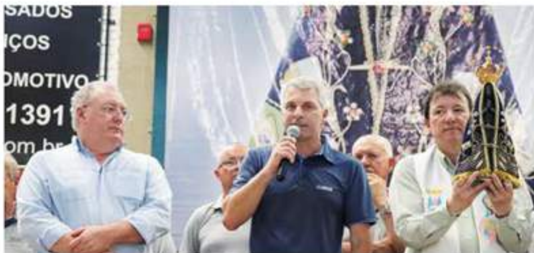
Benção de Nossa Senhora Aparecida aos caminhoneiros